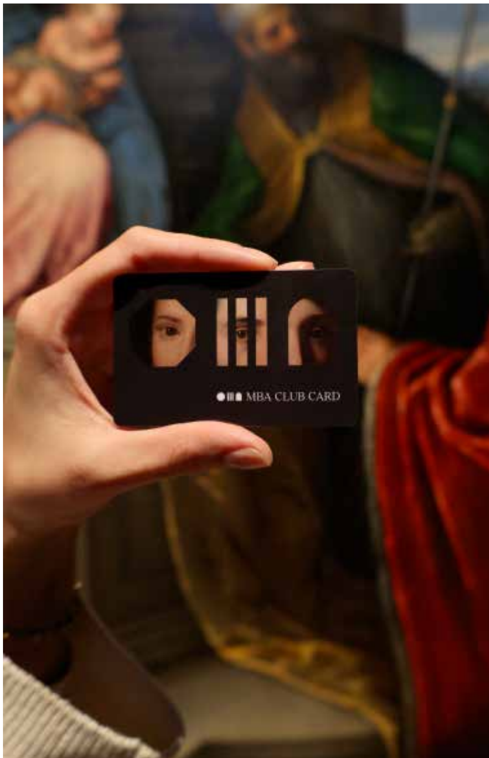
MBA Club Card © MBA Musei Biblioteca Archivio di Bassano del Grappa

DIMENTICA IL BIGLIETTO E TORNA IN MUSEO QUANTE VOLTE VUOI CON MBA CLUB CARD